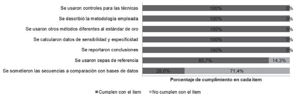
Figura 2. Características metodológicas de los estudios incluidos.